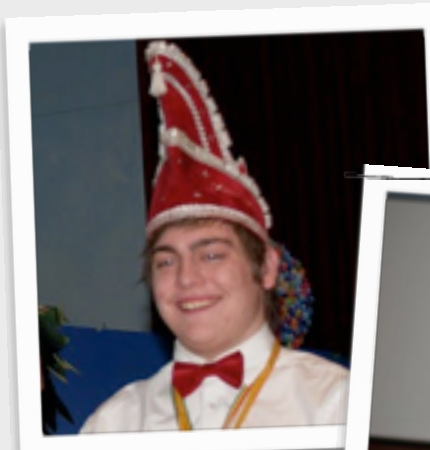
Uit bronnen heeft de redactie vernomen dat Raadslid Edwin in zijn vrije tijd graag als tuinkabouters bij vijvers in andermans tuinen zit.